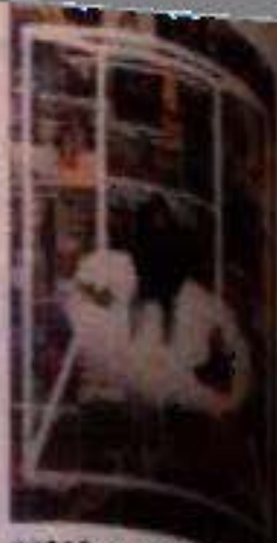
"2012 2013" består av ett collage av 2012 års viktigaste händelser, men sig själv och sin son i den rumsliga perspektivet.